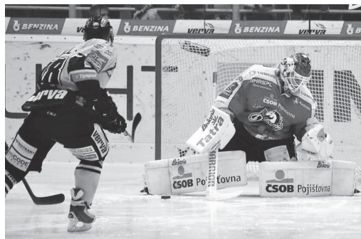
Brankář Maxwell proti Robinu Hanzloví.