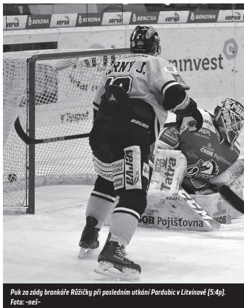
Puk za zády brankáře Růžičky při posledním utkání Pardubice v Litvínově (5:4p).

CITADELA kulturní, společenské a komunitní centrum