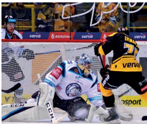
Ihnačákův gól v zápase s Libercem.

15. kolo – pátek, 20. října (ČT) – rozhodčí Pešina a Hribík – 4127 diváků