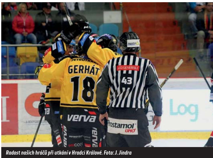
Radost našich hráčů při utkání v Hradci Králové.

V neděli zamíří HC Verva Litvínov do Olomouce (17:00), pak jej čekají tři utkání doma, přerušené reprezentační přestávkou. Před ní v pátek Zlín (17:20) a za týden v neděli Třinec (15:30). -vn-